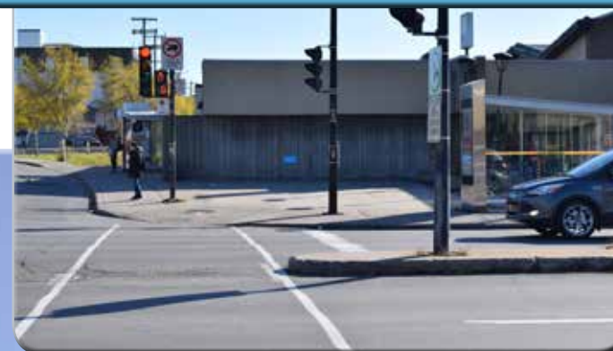
Feu avec décompte piéton