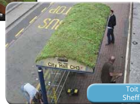
Toit vert d'un abribus Sheffield, Royaume-Uni