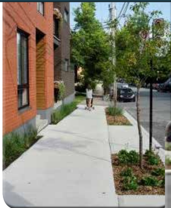
Fosses d'arbres plantées Arrondissement Le Plateau-Mont-Royal