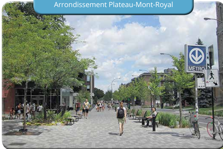
Place du Coteau-Saint-Louis Arrondissement Plateau-Mont-Royal