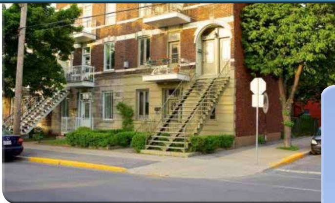
Interdiction de stationner aux intersections Arrondissement Villeray - Saint-Michel - Parc-Extension