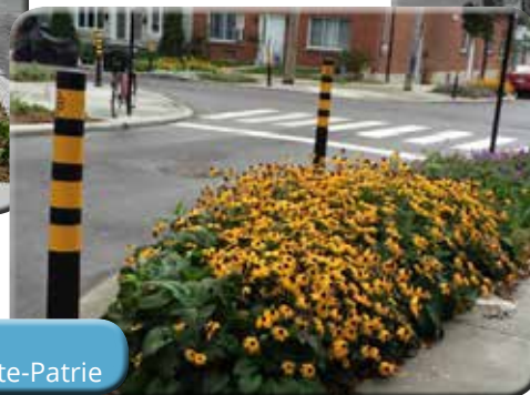
Saillies de trottoir Arrondissement Rosemont-La Petite-Patrie