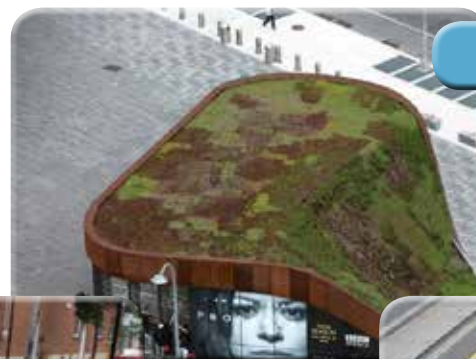
Toit vert d'une station de métro Boston, États-Unis